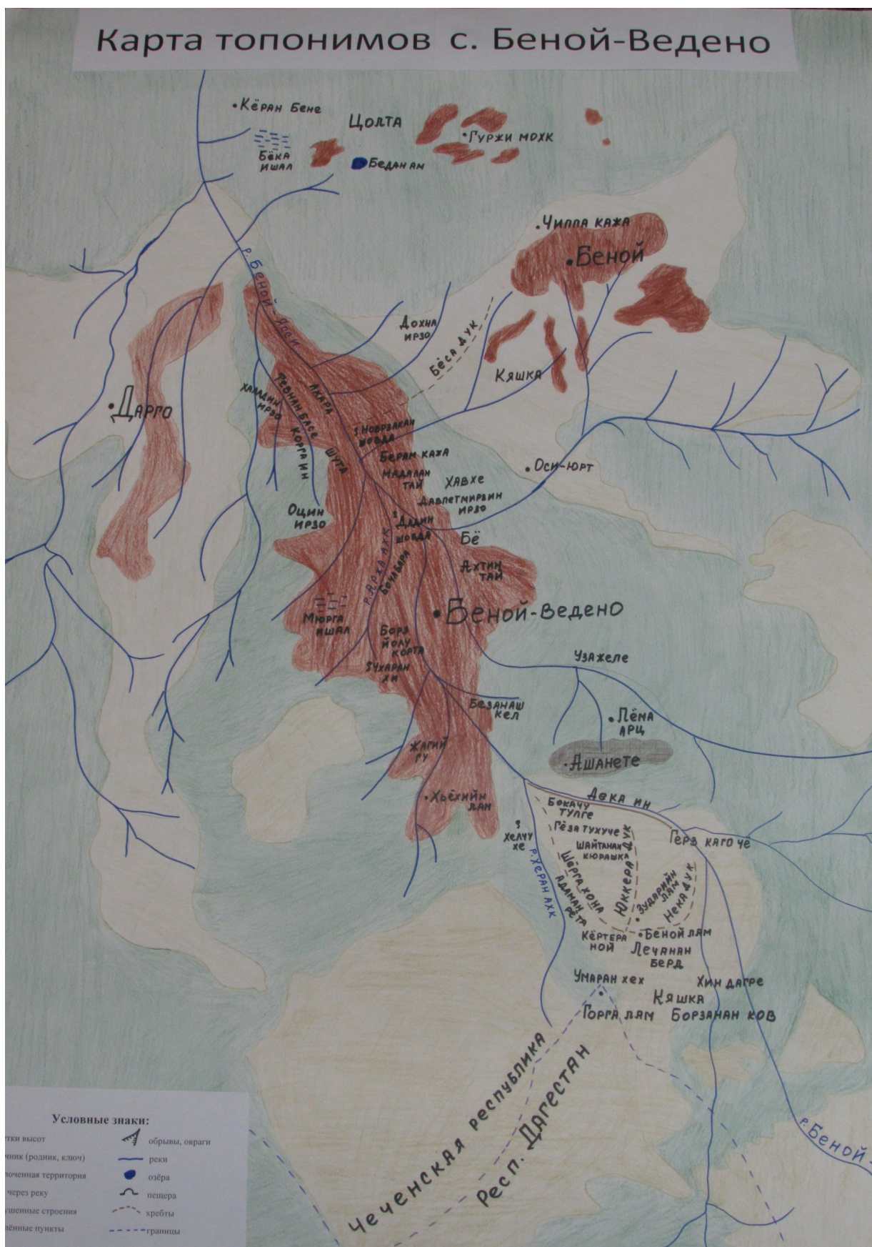
топонимов села Беной – Ведено