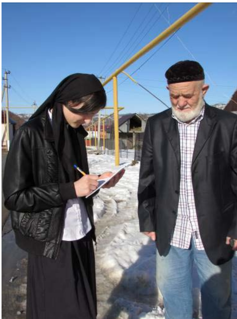
Работа со словарями